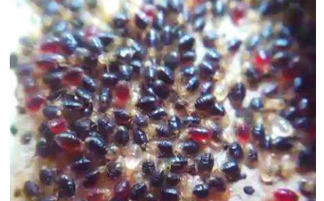
배불리 흡혈한 빈대 약충