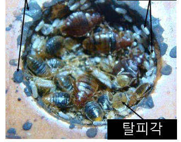
탈피각 알 껍질 배설물