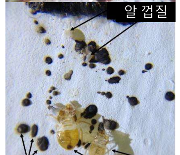
알 껍질 탈피각 알 껍질